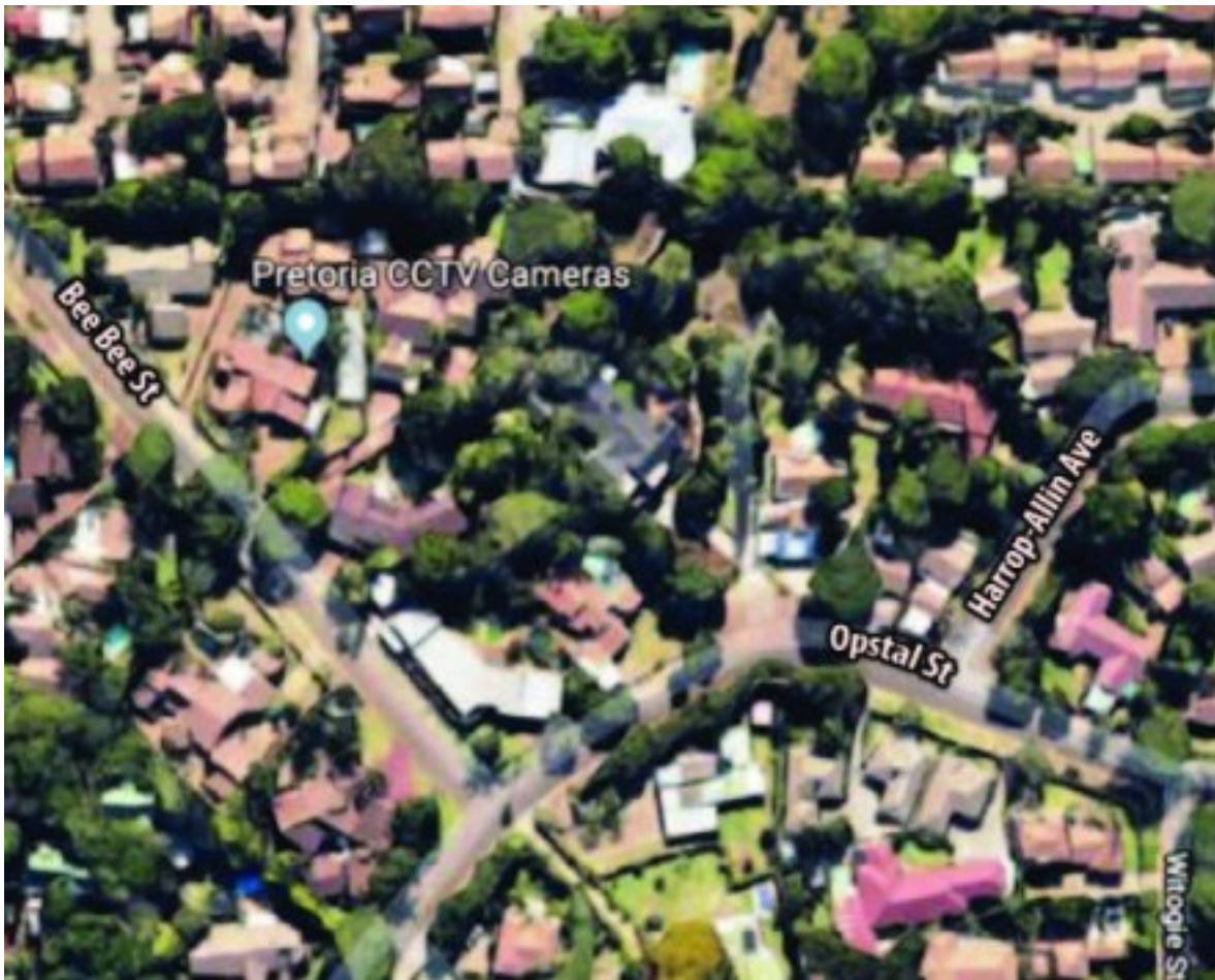
Dié Google Earth satellietkaart wys Bee Beestraat, Opstalstraat en Harrop-Allinlaan