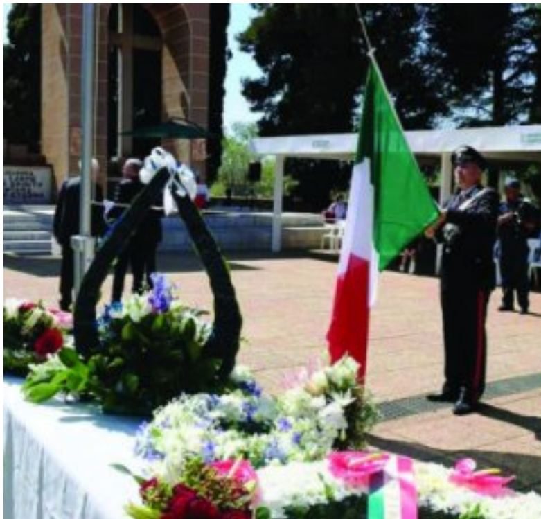
Die vlagseremonie by Zonderwater

Herinneringsdag (Poppy Day) is in 1919 deur Koning George V ingestel om die einde van Eerste Wêreldoorlogse skermutselings op die 11de uur van die 11de dag van die 11de maand in 1918 te gedenk.