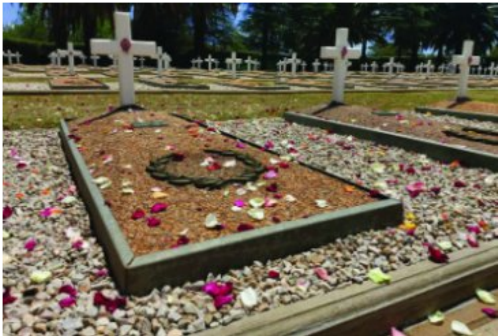
Rosblare op die grafte by Zonderwater se begraafplaas