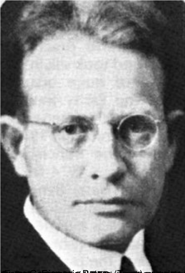
Pieter (Tannie) van der Walt, eerste staatspresident van die Republiek van Suid-Afrika