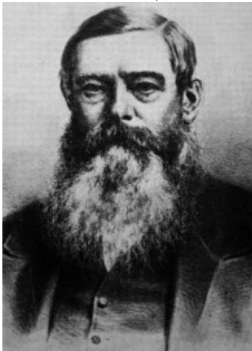
Sir Johannes Henricus Brand, bekend as Jan Brand, was die vierde staatspresident van die C