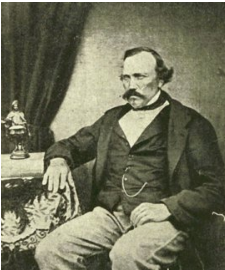
Marthinus Wessel Pretorius was die eerste ZAR-president