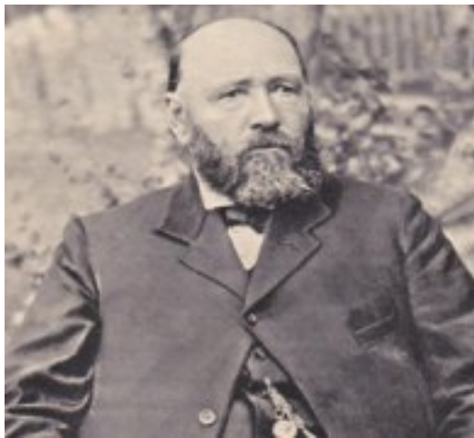
Pieter Arnoldus (Piet) Cronjé, ZAR generaal