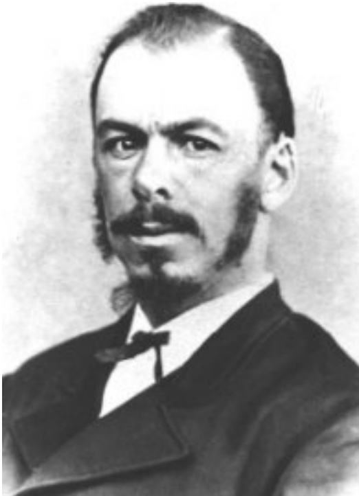
Pieter Jeremias Blignaut was 'n politikus, staatsamptenaar, staatsekretaris van die Oranje-Vrystaat.