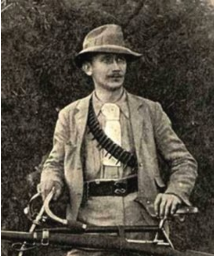
Jan Hendrik Holmeijer (Onze Jan) was by 'De Zuid-Afrikaan', 'Ons Land' en die 'Zuid-Afrikaan'.