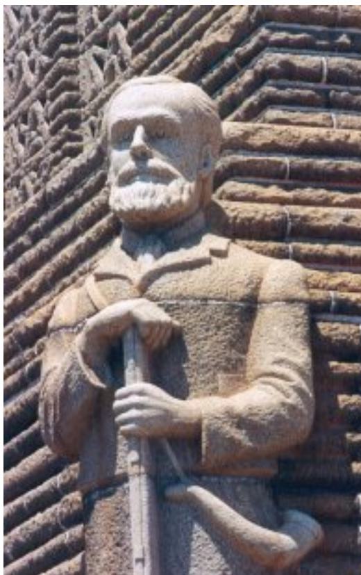
'n Beeld van Piet Retief by die Voortrekkermonument