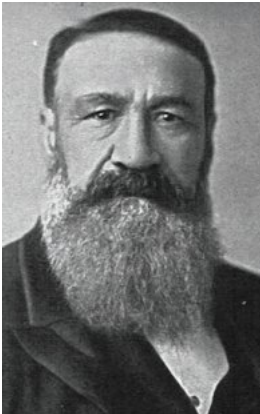
Petrus Jacobus (Piet) Joubert was kommandant-generaal van die ZAR van 1880 tot 1900

Met die vorming van onafhanklike provinsiale losies in die ZAR, Oranje-Vrystaat en Natal, het 'n behoefte ontstaan dat meer streek-grootlosies gevorm moet word en dat Suider-Afrika sy eie verenigde grootlosie, onafhanklik van Engeland, moes hê. Dié beginsel is glo deur die Engelse losies as ongewens verklaar.