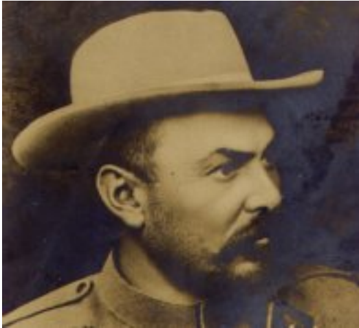
Kommandant-generaal Louis Botha