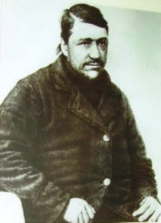
Dié foto van Paul Kruger is in 1864 geneem en hang in Krugerhuis