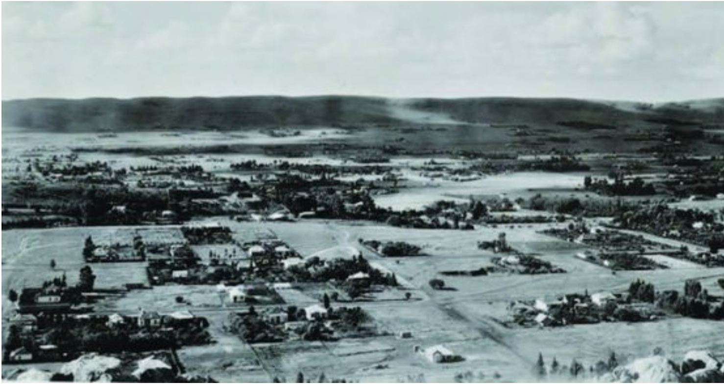
Villieria en Riviera in 1922