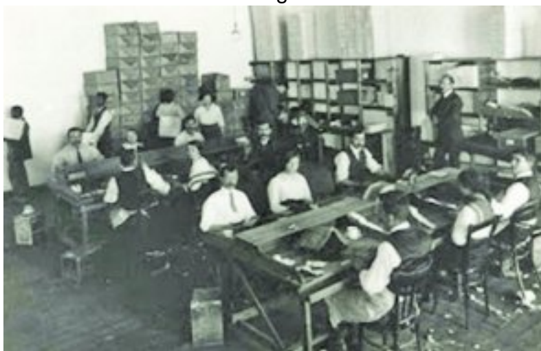
Só het die kantoor binne die gebou gelyk