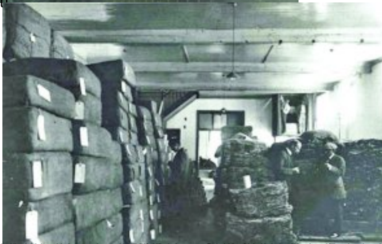
Foto: Die Burger, 1911, 1912, 1913, 1914, 1915, 1916, 1917, 1918, 1919, 1920, 1921, 1922, 1923, 1924, 1925, 1926, 1927, 1928, 1929, 1930, 1931, 1932, 1933, 1934, 1935, 1936, 1937, 1938, 1939, 1940, 1941, 1942, 1943, 1944, 1945, 1946, 1947, 1948, 1949, 1950, 1951, 1952, 1953, 1954, 1955, 1956, 1957, 1958, 1959, 1960, 1961, 1962, 1963, 1964, 1965, 1966, 1967, 1968, 1969, 1970, 1971, 1972, 1973, 1974, 1975, 1976, 1977, 1978, 1979, 1980, 1981, 1982, 1983, 1984, 1985, 1986, 1987, 1988, 1989, 1990, 1991, 1992, 1993, 1994, 1995, 1996, 1997, 1998, 1999, 2000, 2001, 2002, 2003, 2004, 2005, 2006, 2007, 2008, 2009, 2010, 2011, 2012, 2013, 2014, 2015, 2016, 2017, 2018, 2019