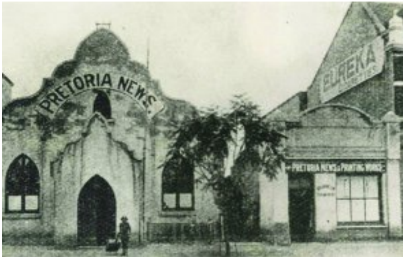
Die 'Pretoria News'-gebou links van die Eureka Sigaretfabriek