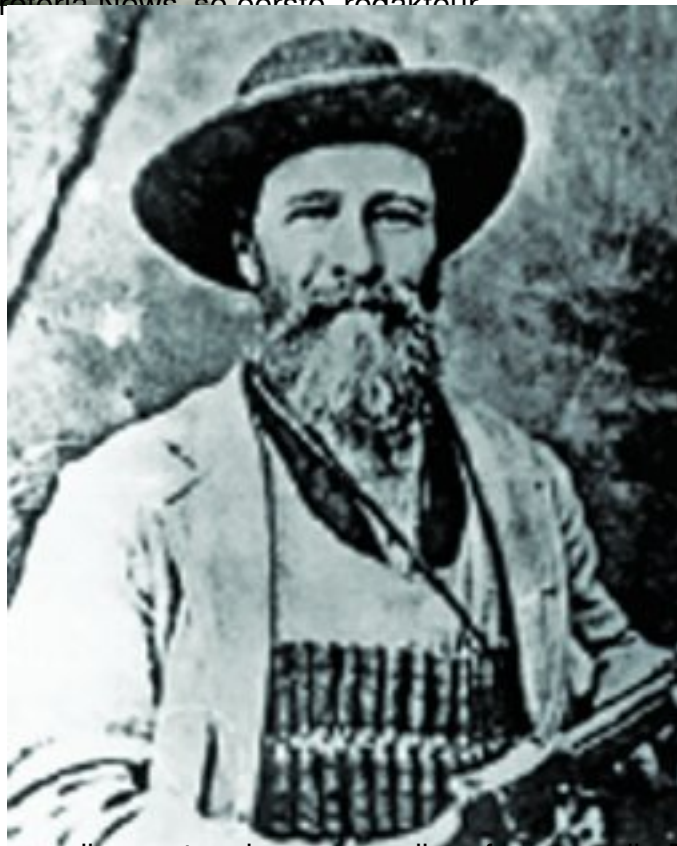
Foto: Eureka's eerste redakteur was 'Proterio News' se eerste redakteur, Melius Resilana