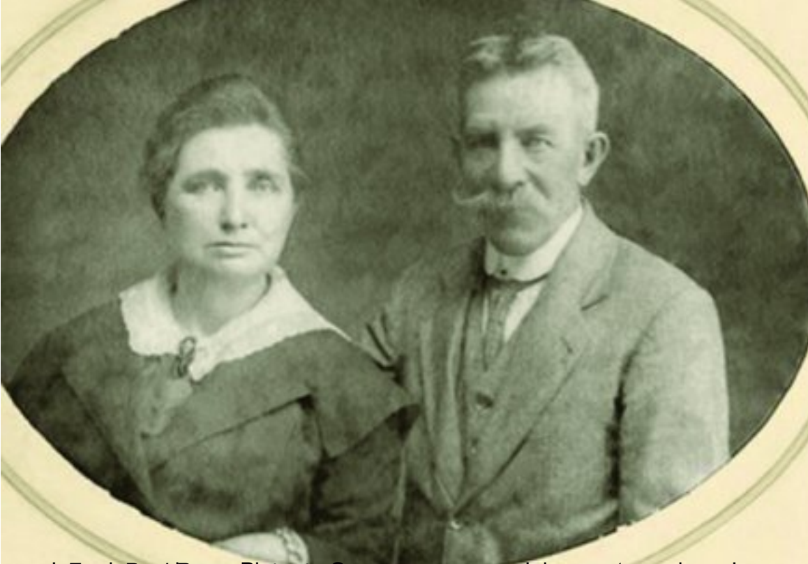
De familie van Oort, die in 1900 in de foto te zien is. De man is de vader van de huidige directeur van de fabriek.