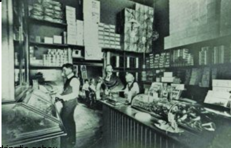
Foto: Die Burger, 1911, 1912, 1913, 1914, 1915, 1916, 1917, 1918, 1919, 1920, 1921, 1922, 1923, 1924, 1925, 1926, 1927, 1928, 1929, 1930, 1931, 1932, 1933, 1934, 1935, 1936, 1937, 1938, 1939, 1940, 1941, 1942, 1943, 1944, 1945, 1946, 1947, 1948, 1949, 1950, 1951, 1952, 1953, 1954, 1955, 1956, 1957, 1958, 1959, 1960, 1961, 1962, 1963, 1964, 1965, 1966, 1967, 1968, 1969, 1970, 1971, 1972, 1973, 1974, 1975, 1976, 1977, 1978, 1979, 1980, 1981, 1982, 1983, 1984, 1985, 1986, 1987, 1988, 1989, 1990, 1991, 1992, 1993, 1994, 1995, 1996, 1997, 1998, 1999, 2000, 2001, 2002, 2003, 2004, 2005, 2006, 2007, 2008, 2009, 2010, 2011, 2012, 2013, 2014, 2015, 2016, 2017, 2018, 2019