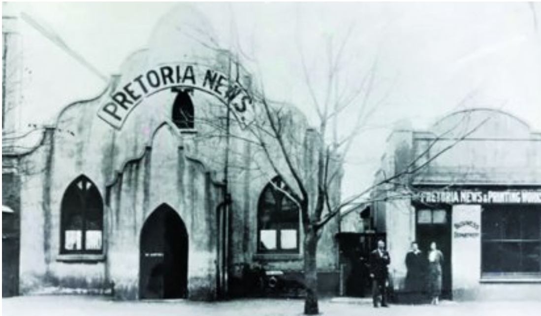
1911, 1912, 1913, 1914, 1915, 1916, 1917, 1918, 1919, 1920, 1921, 1922, 1923, 1924, 1925, 1926, 1927, 1928, 1929, 1930, 1931, 1932, 1933, 1934, 1935, 1936, 1937, 1938, 1939, 1940, 1941, 1942, 1943, 1944, 1945, 1946, 1947, 1948, 1949, 1950, 1951, 1952, 1953, 1954, 1955, 1956, 1957, 1958, 1959, 1960, 1961, 1962, 1963, 1964, 1965, 1966, 1967, 1968, 1969, 1970, 1971, 1972, 1973, 1974, 1975, 1976, 1977, 1978, 1979, 1980, 1981, 1982, 1983, 1984, 1985, 1986, 1987, 1988, 1989, 1990, 1991, 1992, 1993, 1994, 1995, 1996, 1997, 1998, 1999, 2000, 2001, 2002, 2003, 2004, 2005, 2006, 2007, 2008, 2009, 2010, 2011, 2012, 2013, 2014, 2015, 2016, 2017, 2018, 2019