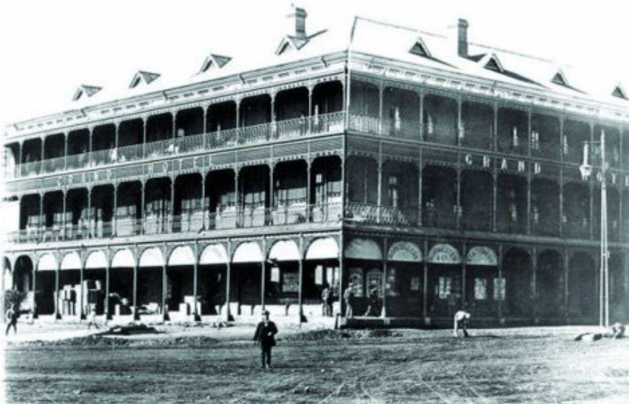
Die Grand Hotel op die suid-oostelike hoek van Kerkplein, soos dit in 1902 gelyk het

Uit dié interneringskamp het Rudolf hordes briewe aan die owerhede geskryf. In Maart 1916 het hy