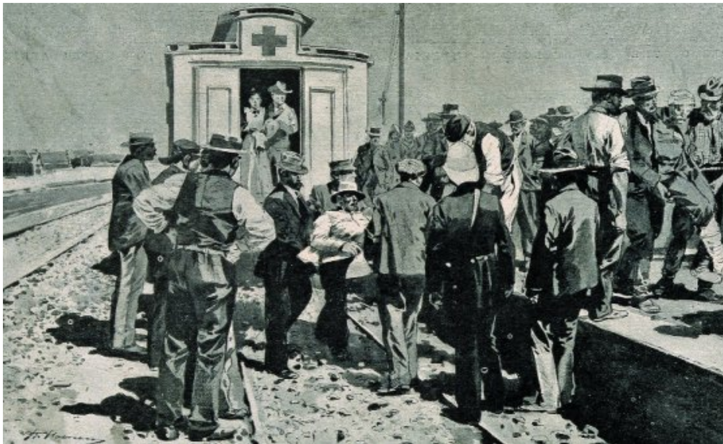
Die Rooikruis-trein kom met gewondes in Pretoria aan