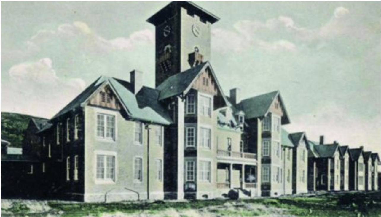
Pretoria Sielsieke Hospitaal

Foto: Braune & Levy, Johannesburg, No 2090