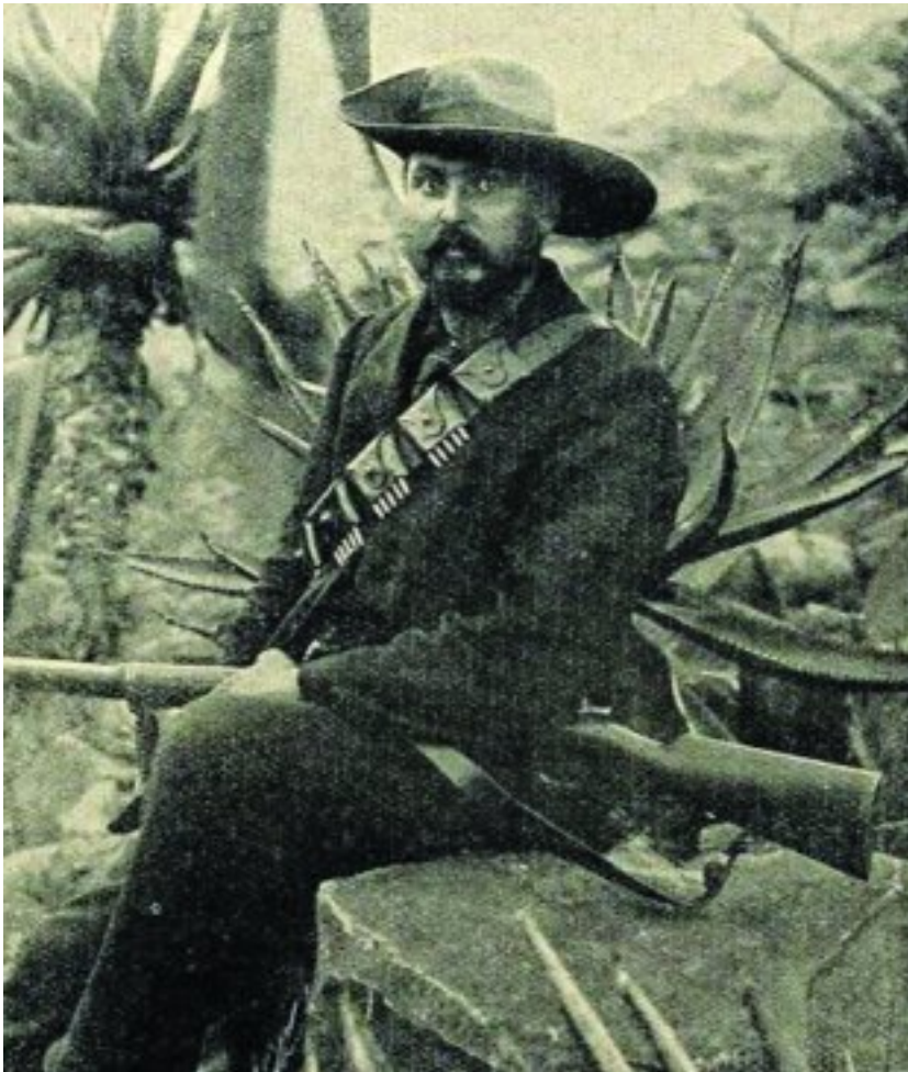
Rudolf het 22 foto's van generaal Louis Botha geneem. Dié een is in 1900 geneem