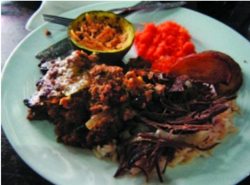
Rooibokboud, bobotie en 'anderste' groente en goed

Die rooibokboud is gesny en versnipper saam met 'n ryk uie- en nog-ietse-sous. Gewoonlik sou ek