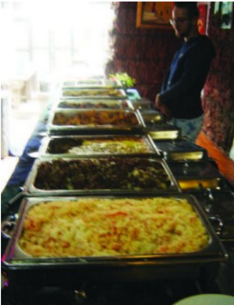
Kranige kelner by die selfskepbakke

Dis nou geensins die bedoeling om Bronkhorstspruit vlak te vat nie, maar ons was regtig nie 'n kui