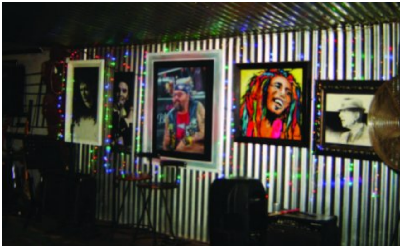
Deel van 'n musiekmuur in die sinkskuur

As dit menslik moontlik was, sou ek later nog van die baie geurige bobotie loop skep. Saam met d