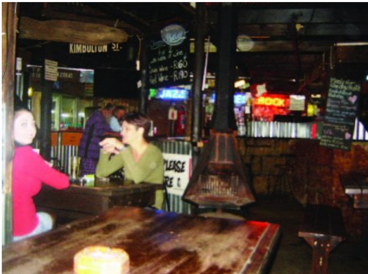
Aansit by 'n stewige houttafel

Met dié dat dit selfskepdag is, gaan ons nie te veel aan die spyskaart herkou nie. Al die nodige en