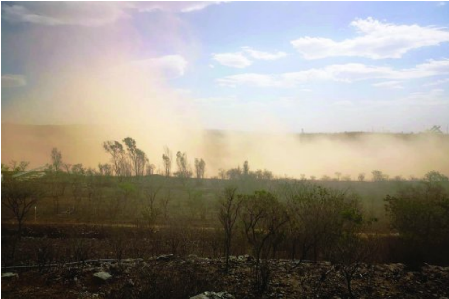
Die inkalwing voor die wind begin het

Die stof het huise deur toe deure en vensters binnegedring en die opruimwerk ná die stofstorm wa