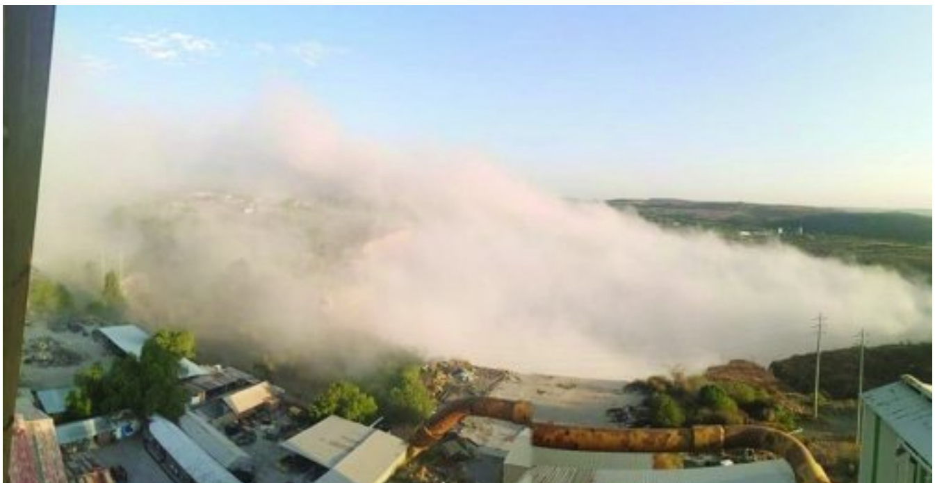
Die begin van die stofwolk in die oopgroef

Mynbou in die oop put op Cullinan is 50 jaar gelede reeds gestaak en alle mynboubedrywighede is