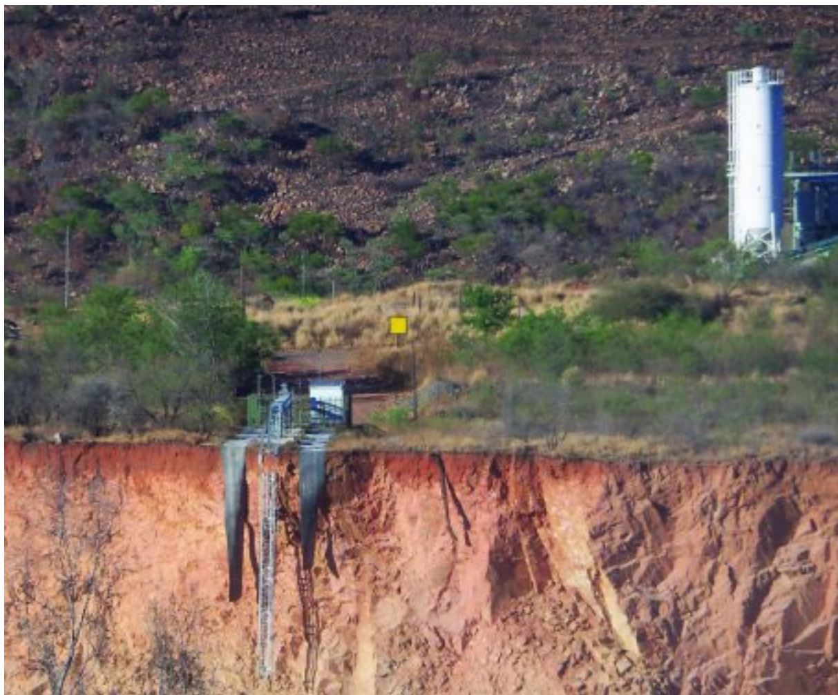
Die moniteringstelsel aan die suid-westekant van die oopgroef ná die wegkalwing