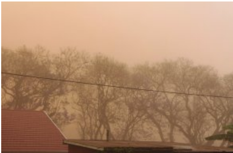
Die verswelgende stofwolk in Oudorp