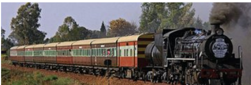
Friends of the Rail is 'n erfenisbewaringsvereniging wat ou stoomtreine restoureer en toeriste op o e-pos aan sales@friendsoftherail.com of skakel 012-767-7913 of 082-098-6186.