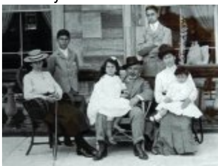
Die statige Victoria sales@zwartkopie.be Besoek Sammy Marks se museum op die plaas Zw