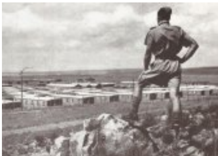
Zonderwater Italiaanse Krygsgevangenekamp-museum herdenk die Italiaanse krygsgevangenes v