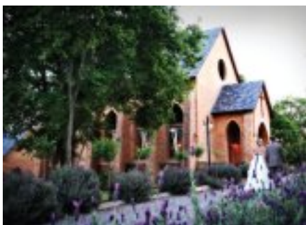
Riverside Castle, met sy romantiese, moderne Middeleeuse versigtelike, is 'n idilliese omgewing