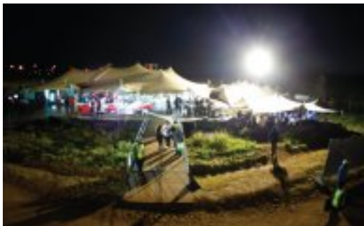
Die Tribe One: Dinokeng Musiekfees gaan op 26, 27 en 28 September buite Cullinan gehou word