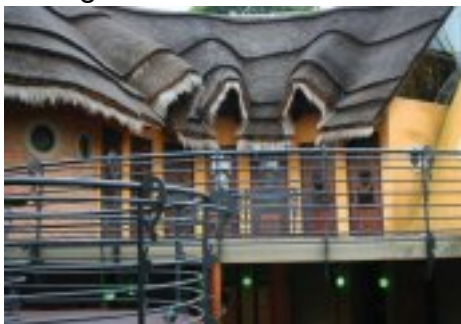
Galagos is gesetel in 'n sprokiesagtige groefhede wat 'n tikkie wondergalagos.co.za aan enige gro