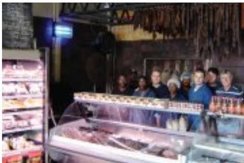
Die kranige slagters van Rayton Biltong en Braai berei jou lam, vark, beessnit of -kwart of wildsbok