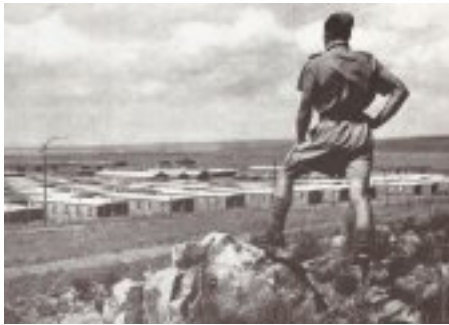
Zonderwater Italiaanse Krygsgevangenekamp-museum herdenk die Italiaanse krygsgevangenes v