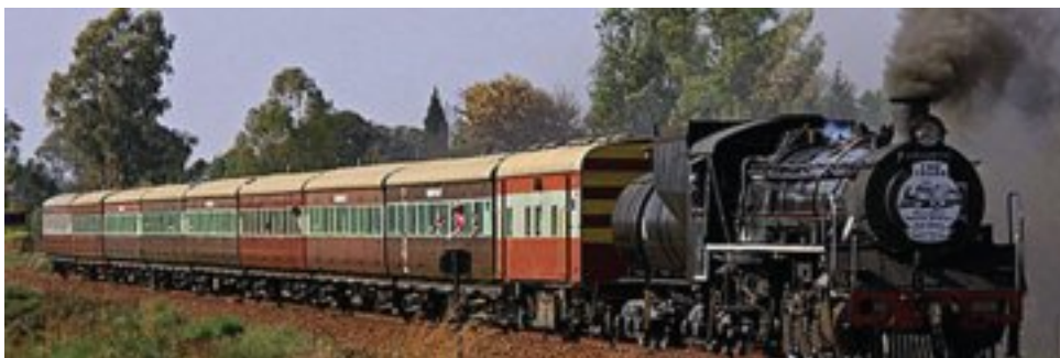
Friends of the Rail is 'n erfenisbewaringsvereniging wat ou stoomtreine restoureer en toeriste op o e-pos aan sales@friendsoftherail.com of skakel 012-767-7913 of 082-098-6186.