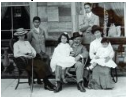
Die statige Victoria anses@psia.zwartkopie Bel wat Sammy Marks grys/sag simonale plas Zw