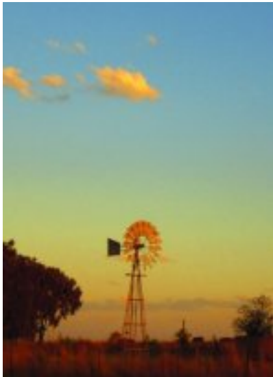
Sonsondergang by Zonderwater.