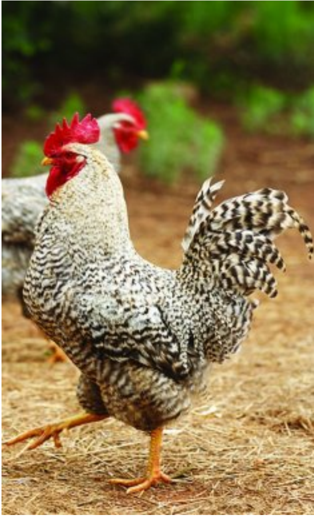
'n Potchefstroomse Koekoek