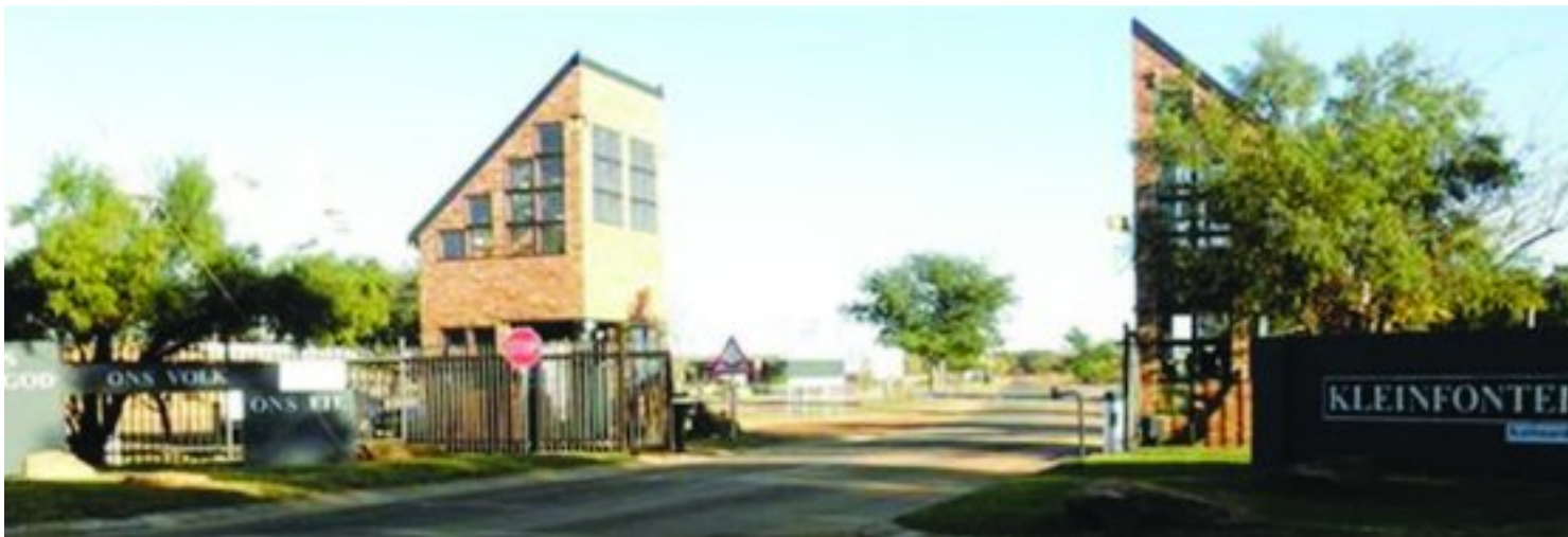
Toegang tot Kleinfontein Kultuurdorp

Almal word uitgenooi om daaraan deel te neem.