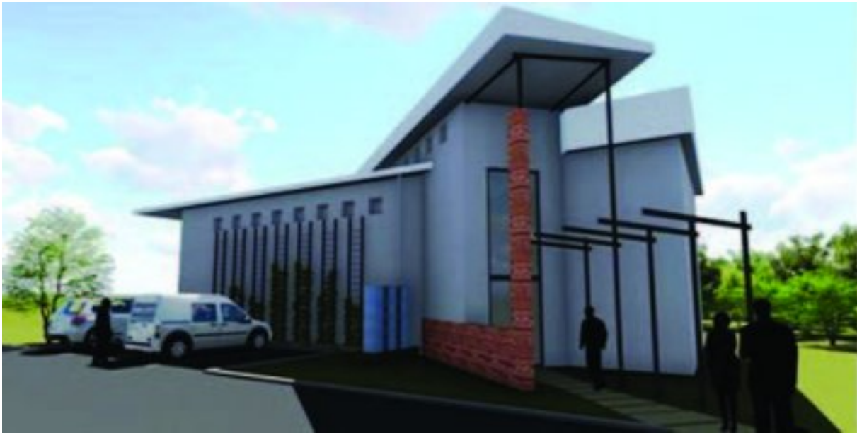
Voorstelling van die voltooide sentrum

Kos-bare private bronnemateriaal lê onder stof in motorhuise en pakkamers en vele daarvan het a