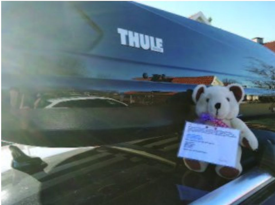
Coca-cola op die lughawe by Stockholm, Swede

vertel dat die beertjie se wêreldtoer afgeskop het toe hy by 'n vulstasie in Mantorp neergesit is. Hy is gou opgetel en het vir 'n paar maande in Swede rondgetoer. Daarna het hy by 'n gesin aangesluit en saam met hulle na Rostock in Duitsland getoer. Die reis met dié gesin het hom later ook deur die Tsjeggiese Republiek en Oostenryk geneem.