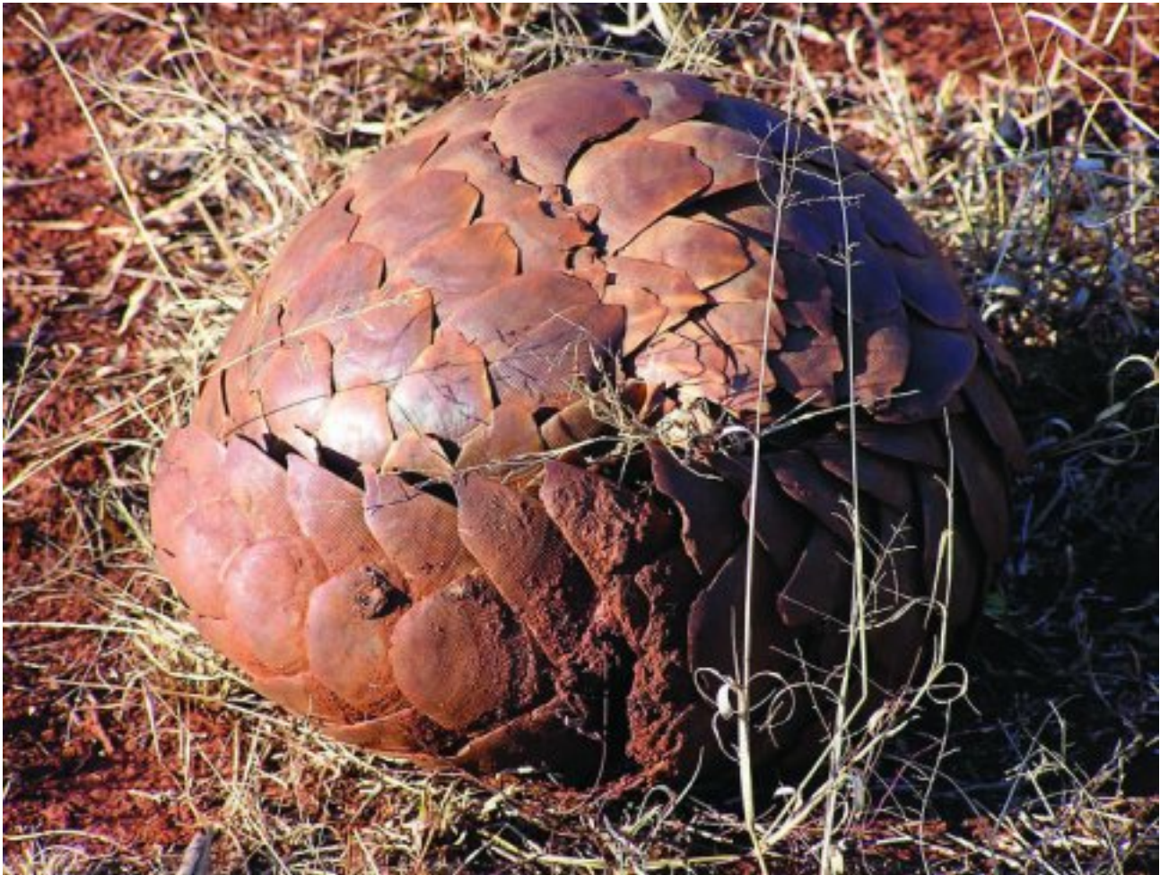
'n Ietermagog rol hom in 'n bal op wanneer hy bedreig voel